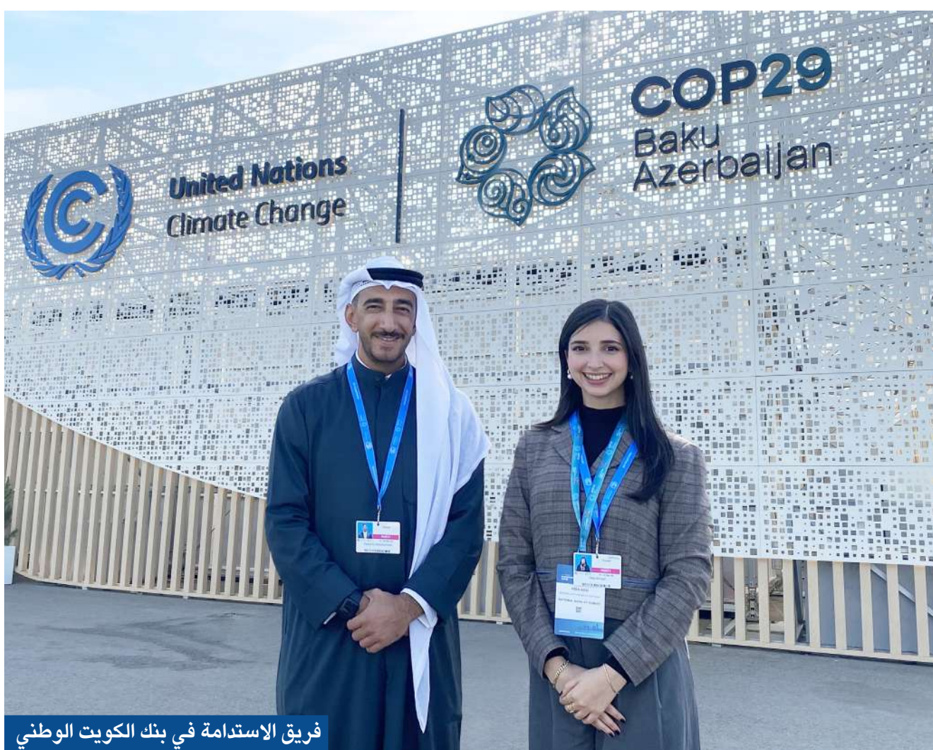
فريق الاستدامة في بنك الكويت الوطني

«الوطني» شارك في جلسة نقاشية حول تمويل التحول إلى الطاقة منخفضة الكربون وفي «قمة التحول إلى الهيدروجين»