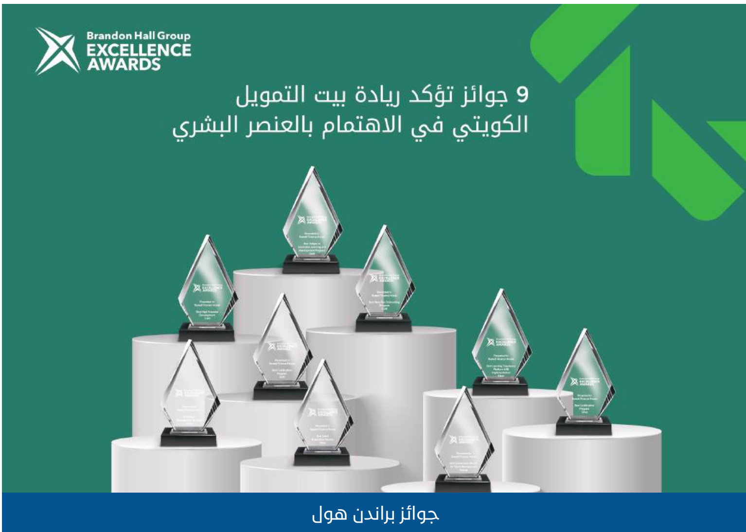
جوائز براندن هول

90,000 ساعة تدريب تخريج أكثر من 50 موظفا من أكاديمية القيادة - Leader-ship Academy تخريج 11 موظف من «هارفارد» ضمن مبادرة «كفاءة»... العدد الأكبر على مستوى البنوك تكريم 60 من خريجي برنامج البعثات في دراسة الماجستير والبيكالوريوس 90% نسبة المشاركة في استبيان ارتباط الموظفين 9 جوائز مرموقة من مجموعة «براندون هول» العالمية تكريم 232 موظفاً في حفل «قدها» السنوي لعام 2024 و155 موظفاً في الحفل نصف السنوي لعام 2025. تكريم 64 من أبناء الموظفين المتفوقين في المرحلة الثانوية