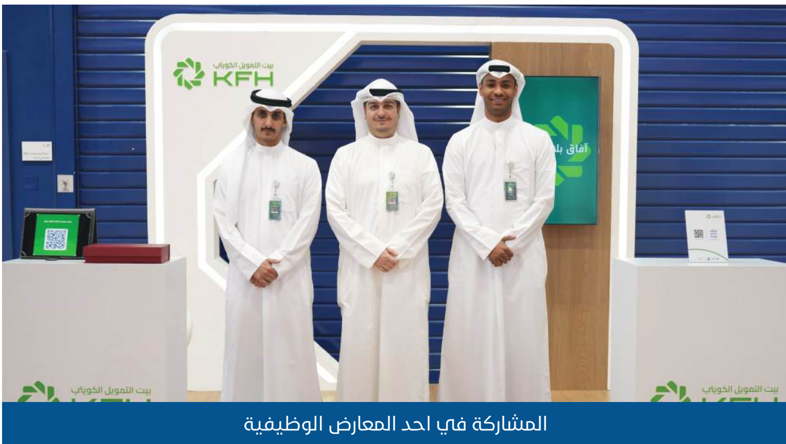
المشاركة في احد المعارض الوظيفية