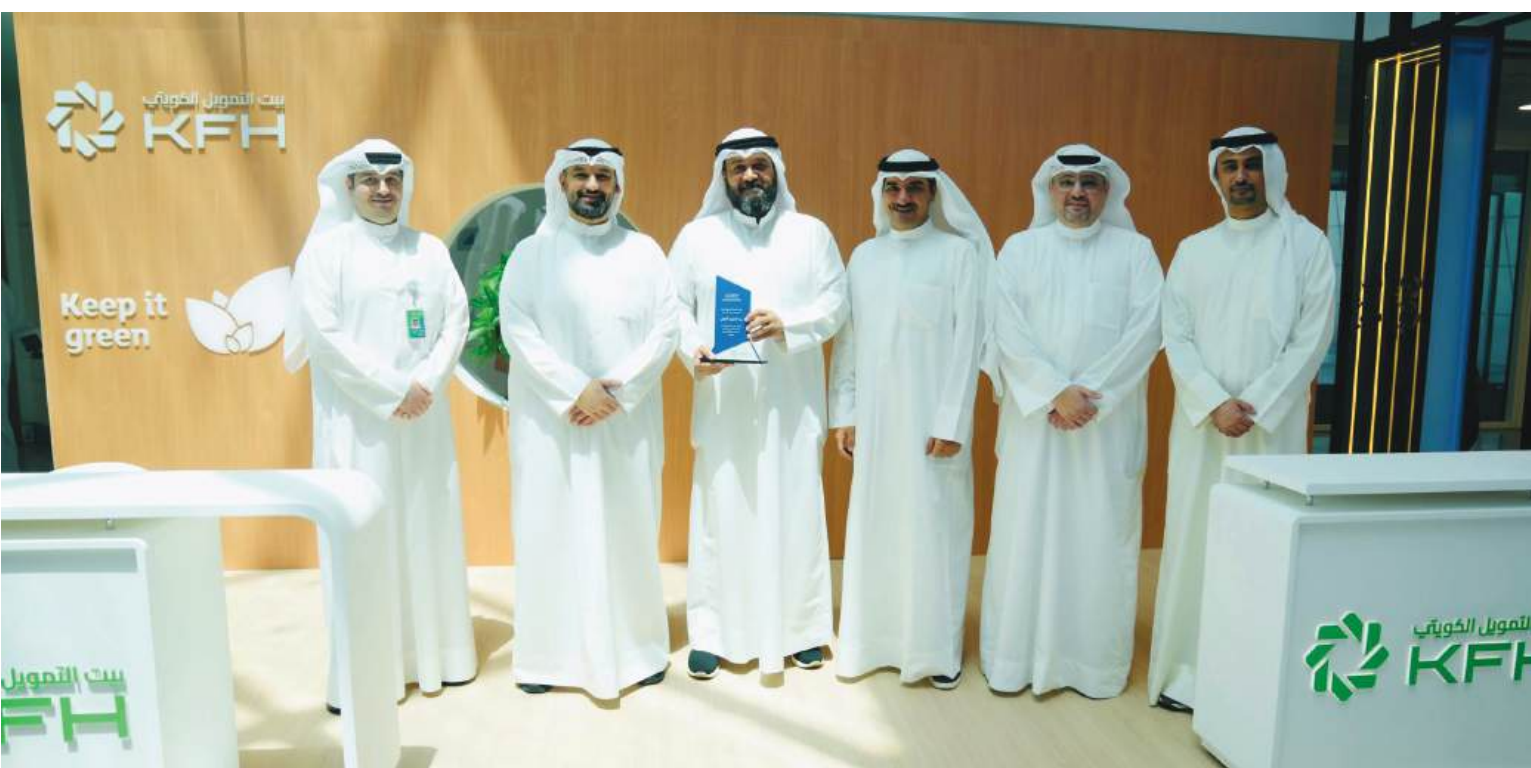
تكريم بيت التمويل الكويتي من جامعة الخليج

وإيمانًا من بيت التمويل الكويتي بالراسخ بأهمية الاستثمار في العنصر البشري وإعداد جيل جديد من القادة القادرين على تحقيق التميز والابتكار في العمل المصرفي، تم تخريج دفعة جديدة تصل إلى أكثر من 50 مشاركًا من الكفاءات القيادية المتميزة من أكاديمية القيادة (Leadership Academy)، وذلك في مدريد بالتعاون مع (Headspring)،