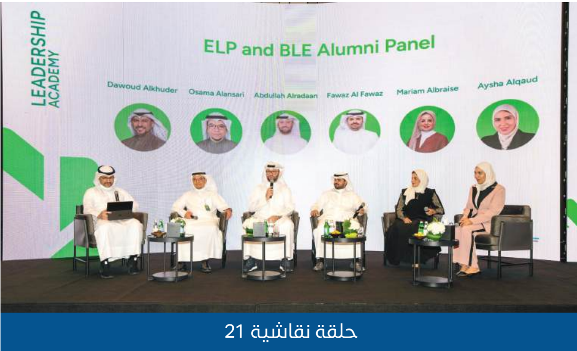
حلقة نقاشية 21