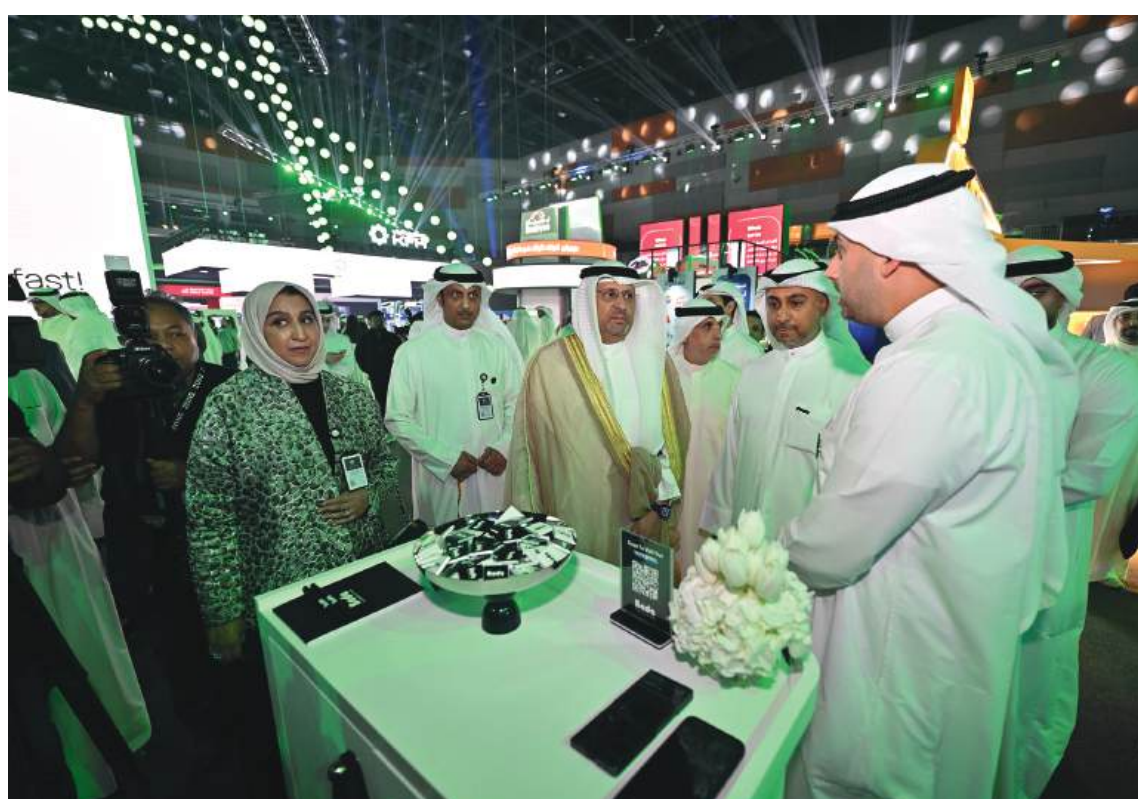
الوزير عمر العمر يتفقد جناح BEDE في معرض NEXUS

كشفت مجموعة زين عن علامتها التجارية «BEDE الكويت» (بيدي) - المعروفة سابقاً باسم - Boo-key- خلال مشاركتها في معرض NEXUS 2025، الحدث الذي جمع بين التكنولوجيا والابتكار مع ريادة الأعمال.