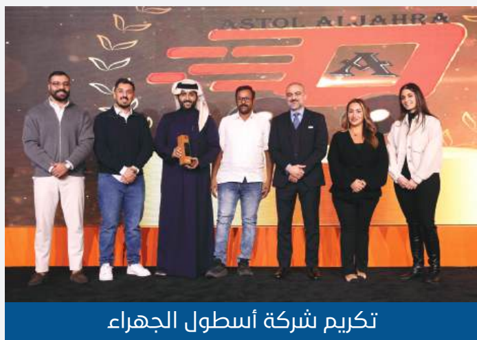
تكريم شركة أسطول الجهراء