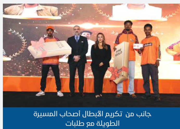
جانب من تكريم الأبطال أصحاب المسيرة الطويلة مع طلبات

لوجستية جديد (النجم الصاعد)، جائزة التميّز في التواصل وسرعة الاستجابة، جائزة التميّز في إدارة العمليات خلال مواسم الذروة، جائزة أفضل مشاركة في الأنشطة التفاعلية، جائزة أفضل أداء تشغيلي، بطل الأداء خلال ساعات الذروة، جائزة أفضل التزام بالأنظمة والتعليمات، وجائزة التميّز في جودة إجراءات الانضمام والتأهيل.