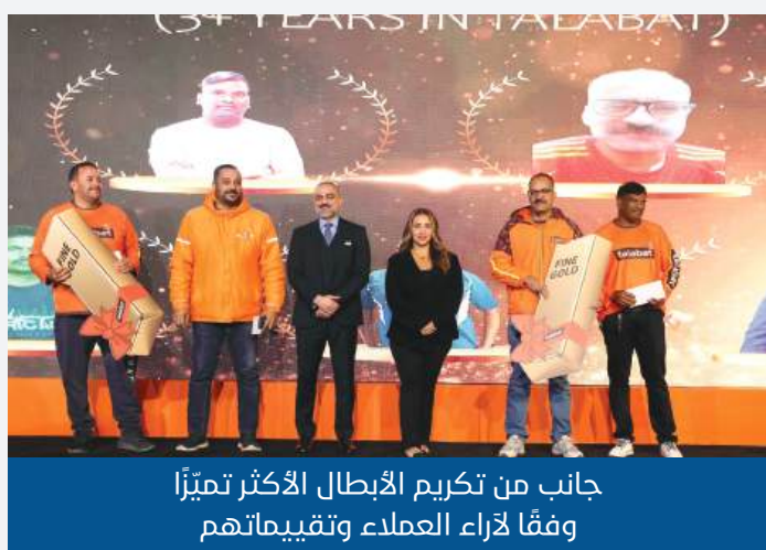
جانب من تكريم الأبطال الأكثر تميّزاً وفقاً لآراء العملاء وتقييماتهم