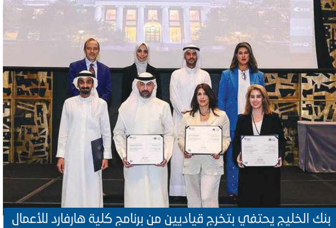
بنك الخليج يحتفي بتخرج قياديين من برنامج كلية هارفارد للأعمال