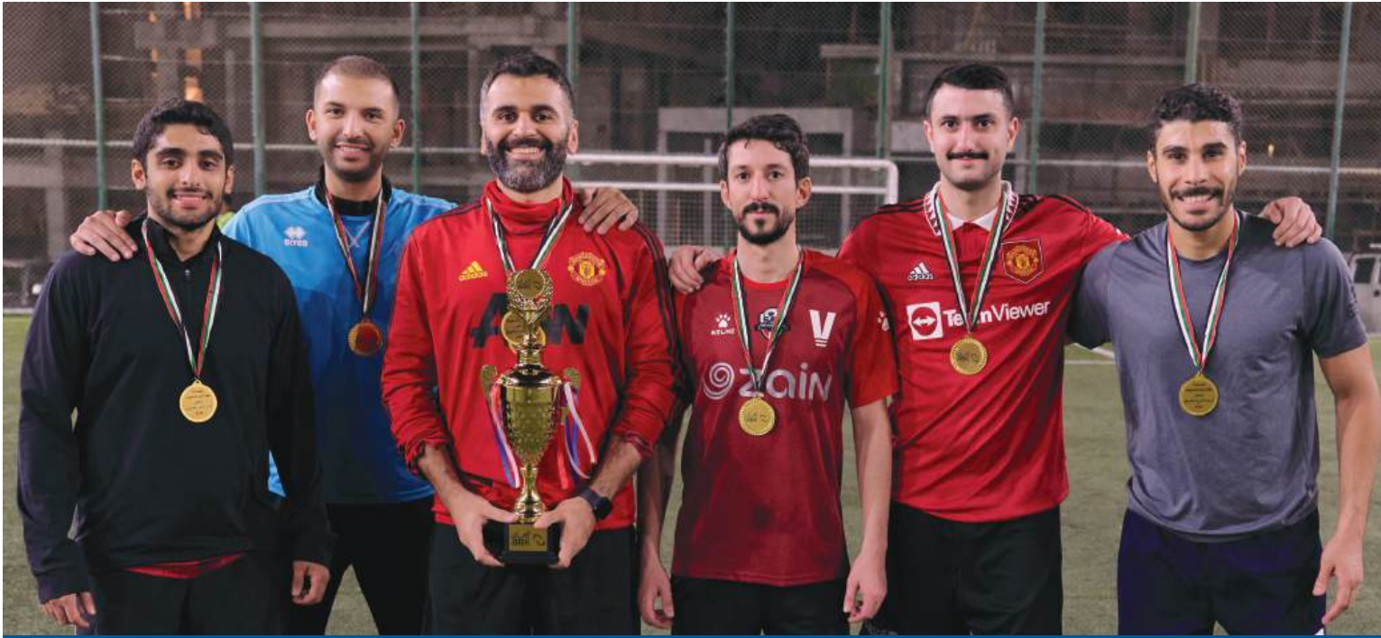
الفريق الفائز بالمركز الأول