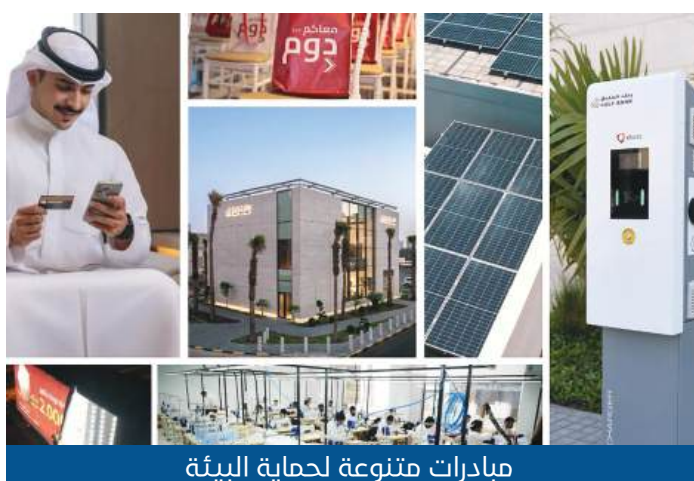
مبادرات متنوعة لحماية البيئة