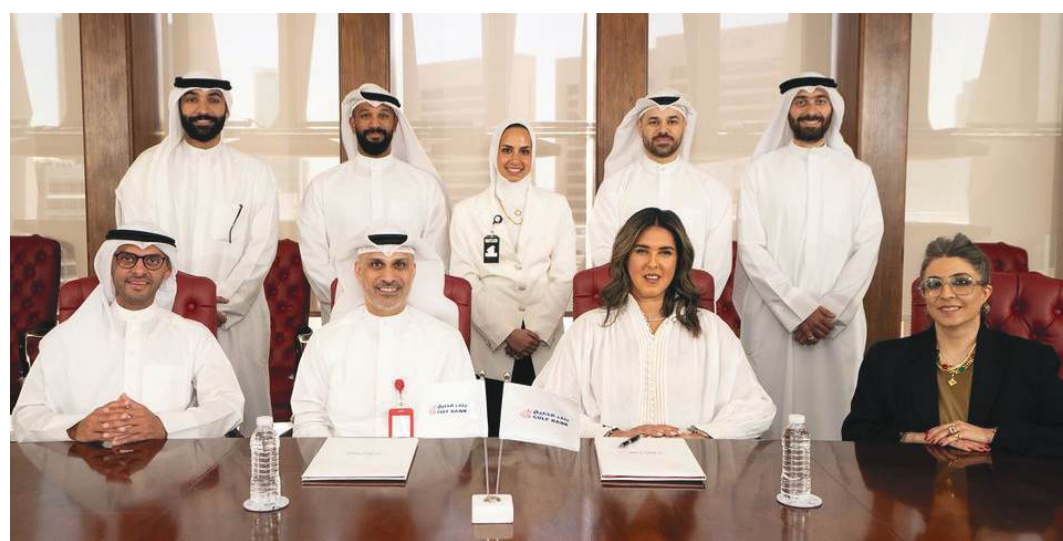
توقيع اتفاقية شراكة مع معهد الدراسات المصرفية لتدريب موظفي البنك على الصيرفة الإسلامية

إنجاز مشروع تطوير المقر الرئيسي للبنك في قلب العاصمة وفقاً لمعايير الاستدامة والمباني الخضراء مع الحفاظ على قيمته التراثية