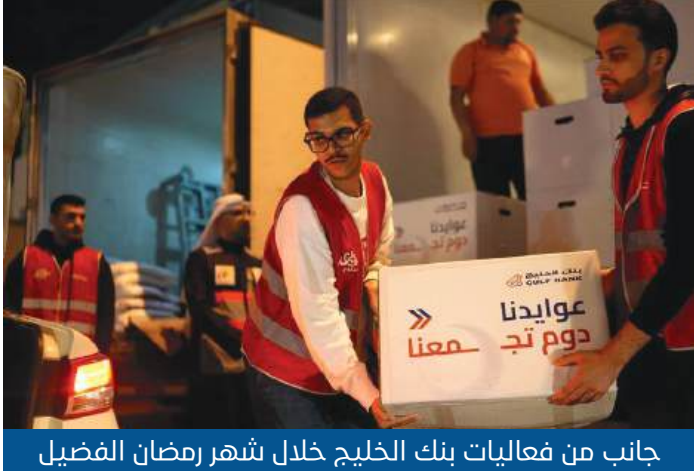
جانب من فعاليات بنك الخليج خلال شهر رمضان الفضيل