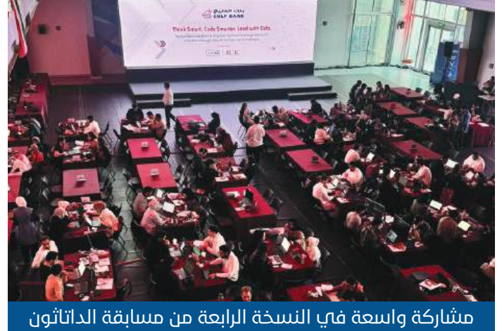
مشاركة واسعة في النسخة الرابعة من مسابقة الداتاثون