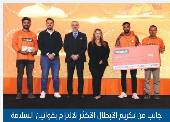
جانب من تكريم الأبطال الأكثر الالتزام بقوانين السلامة