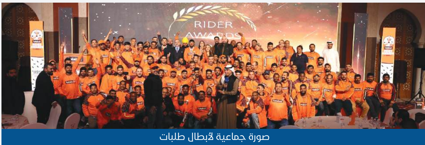
صورة جماعية لأبطال طلبات