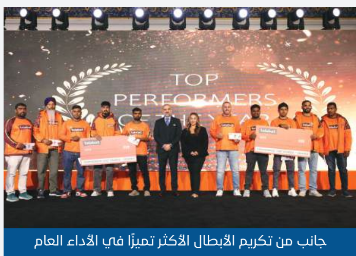
جانب من تكريم الأبطال الأكثر تميّزاً في الأداء العام