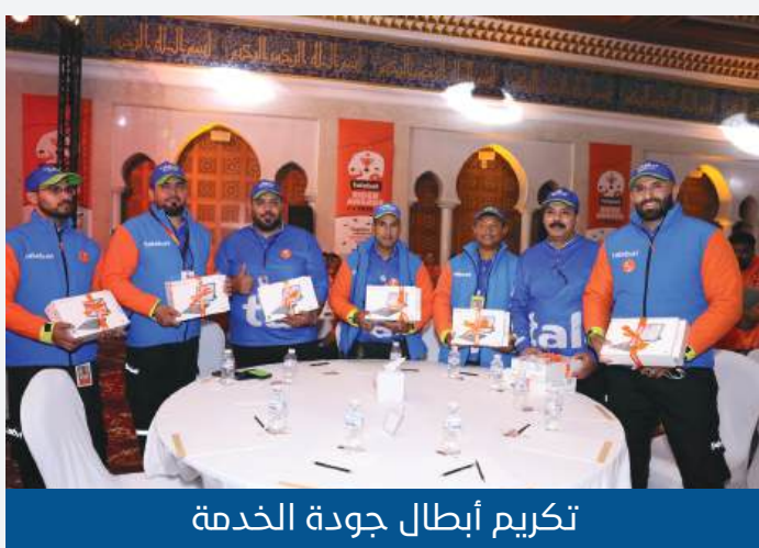
تكريم أبطال جودة الخدمة