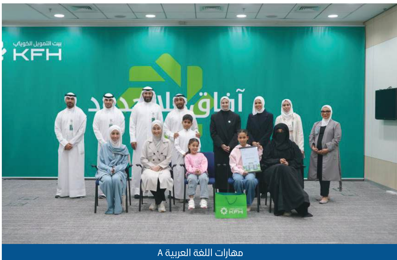
مهارات اللغة العربية A

تنظيم فعاليات ضمن الاهتمام بالموظف والهوية الثقافية للمجتمع