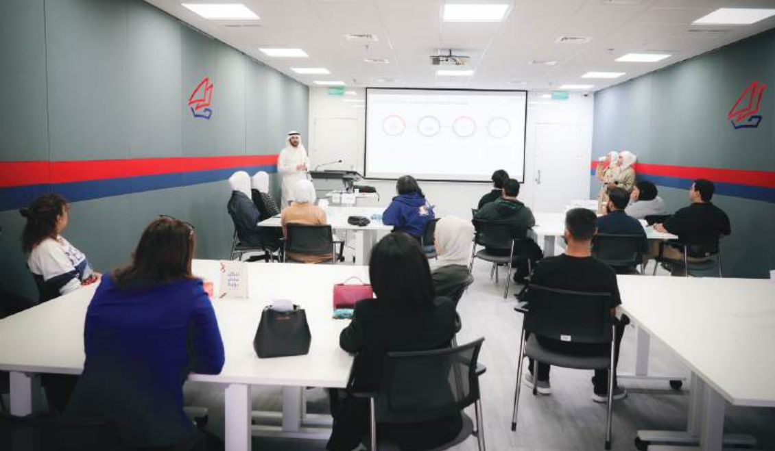
طلاب الجامعة الأسترالية يستمعون لشرح عن عمل إدارة الخزينة