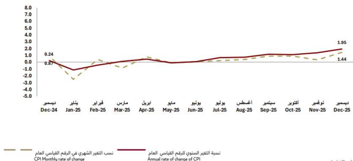
Graph (3) Monthly and annual change of CPI % Dec 24 – Dec 25

سعر 3 مجموعات على رأسها الصحة بواقع 0.75%، واستقر سعر مجموعة التبغ. وعلى المستوى الشهري، فقد ارتفع سعر 8 مجموعات أيضاً في صادراتها البلع والخدمات الأخرى بنحو 1.87%، فيما انخفض سعر مجموعة التعليم بـ 0.02%، واستقر سعر 3 مجموعات أخرى. وبحساب الرقم القياسي العام لأسعار المستهلك في دولة قطر بعد استبعاد مجموعة السكن والمياه والكهرباء وأنواع الوقود الأخرى فقد ارتفع سنوياً بنحو 2.05%، ونما بواقع 1.71% على أساس شهري.