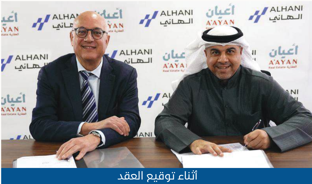
أثناء توقيع العقد