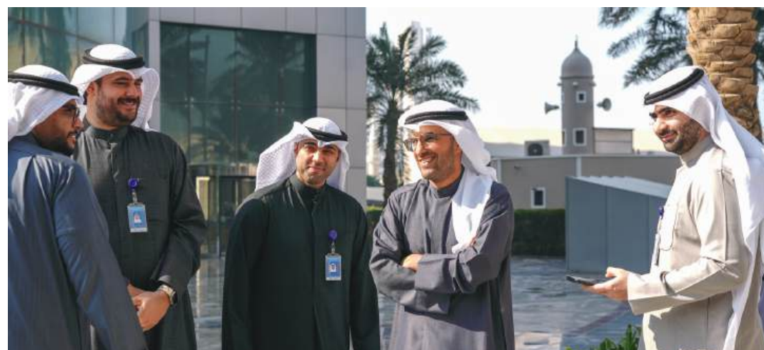
موظفي بنك برقان خلال الحفل