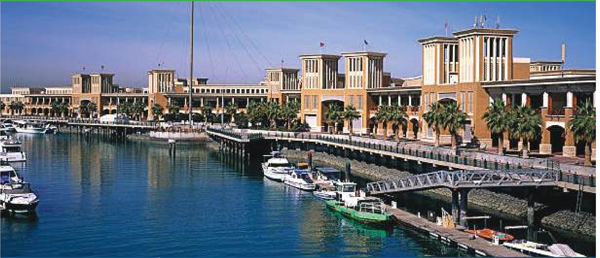
واجهة مميزة... هل تشهد فندق 5 نجوم يحاكي تحول الكويت سياحياً

فارق عن المركز الثاني بنسبة 43% والثالث بنسبة 75%