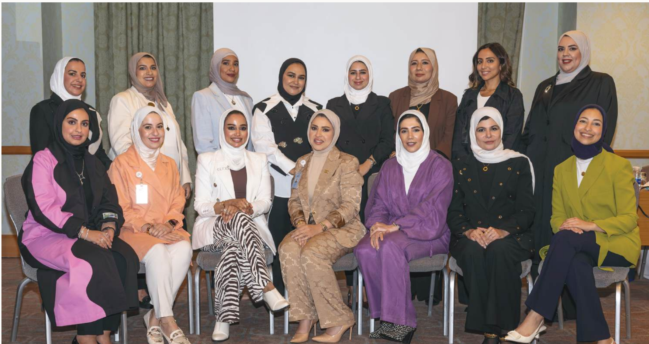
لقطة جماعية لموظفات بوبيان المشاركات في البرنامج

تمكين المشاركات بمهارات وأدوات القيادة الحديثة عبر محاور متنوعة شملت: القيادة الشخصية وبناء الهوية المؤسسية القوية، وإدارة فرق العمل، إلى جانب الابتكار والتعامل مع التغيير وتحقيق التوازن بين العمل والحياة الشخصية.