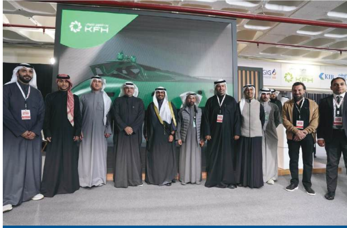
زيارة جناح بيت التمويل الكويتي

ويمكن أن يختار العميل سيارة أو قارب او دراجة مقابل ضمان مالي، الاستفادة من فترة السداد المرنة التي تمتد إلى 10 سنوات وبأرباح تنافسية وبرامج سداد متنوعة، ويُمنح هذا التمويل للأفراد، مقابل ضمان مالي كامل على المديونية الإجمالية ، ويكون الحجز على ودائع ثابتة للعميل ، ويوفر هذا المنتج تغطية الاحتياجات التجارية للعملاء الأفراد من سيارات وقوارب ودراجات، إذ ان سقف التمويل مفتوح ويحدد بقيمة الوديعة ، مع توافر مجموعة امتيازات أخرى للمنتج منها سريان أرباح الوديعة للعميل طوال فترة الائتمان، وسرعة الإنجاز مع أرباح تنافسية.